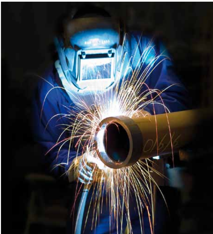
Komplettlösung aus einer Hand - Zertifizierte Schweißtechnik durch Musmann direct

Treten während diverser Projekte unerwartet starke Korrosionsschäden in bestimmten Tankanlagen oder Druckluftwasserkesseln auf, so ist es unserer Disposition in Zukunft möglich noch flexibler zu agieren und aus einem breiten Pool an Schweißern kurz-